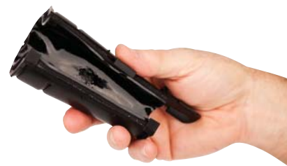
Механическая муфта 3M™ для герметизации разъемного соединения DIN 7-16 для использования в беспроводных сетях нового поколения