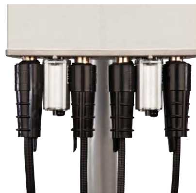
Механическая муфта 3M™ Slim lock на антенне MIMO